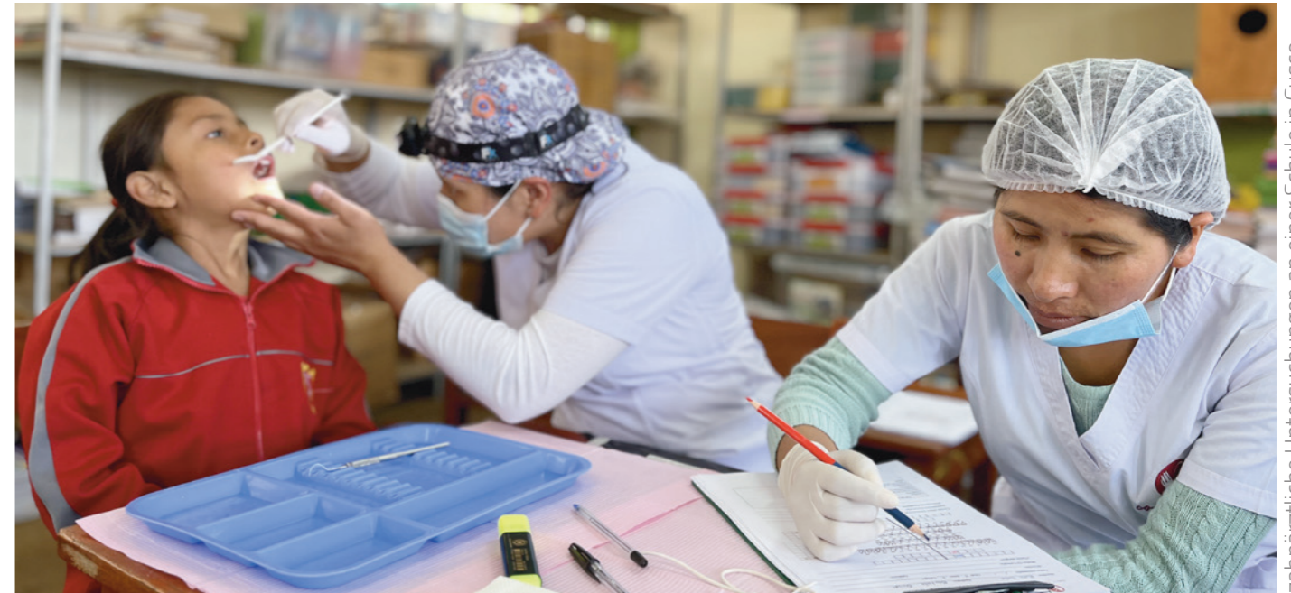
zahnärztliche Untersuchungen an einer Schule in Cusco

Dieses schöne Projekt ist neu und wir haben es seit August 2023 umgesetzt. Dank der NGO «Pietro Ruggeri», die daran interessiert ist, durch gesunde Ernährung zu einer besseren Welt beizutragen, konnten wir den Traum vieler Eltern wahr werden lassen. Anämie ist ein Problem der öffentlichen Gesundheit in Peru. Nach Angaben der Regierung liegt die Prävalenz von Anämie bei Kindern zwischen 6 und 35 Monaten bei 40,9%, was etwa 700'000 Säuglingen entspricht. Dies ist zweifelslos eine alarmierende