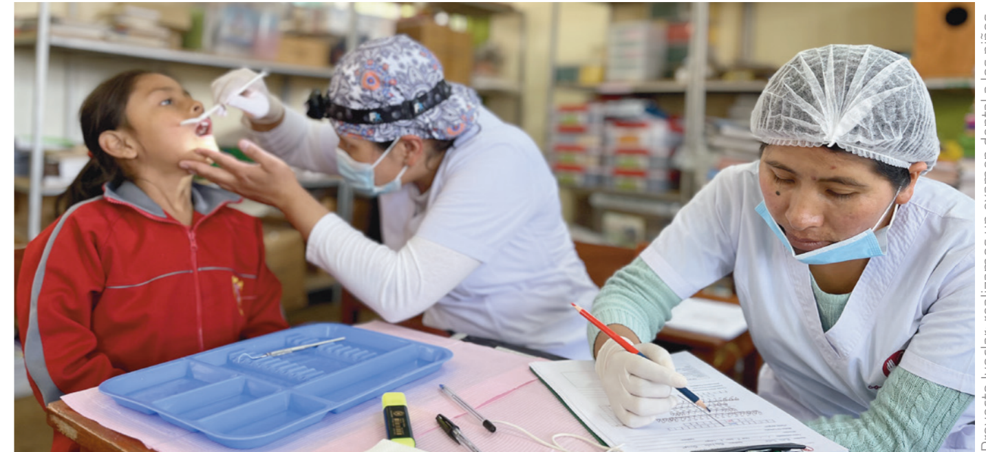
Proyecto Ivoclar: realizamos un examen dental a los niños

Este hermoso proyecto es nuevo y lo hemos implementado en el mes de agosto de 2023. Gracias a la ONG "Pietro Ruggeri" interesada en contribuir a un mundo más saludable a través de la nutrición, pudimos hacer realidad el sueño de muchos padres. La anemia es un problema de salud pública en el Perú. Según el gobierno, su prevalencia en niños de entre 6 y 35 meses es del 40,9%, cifra que equivale aproximadamente a 700.000 infantes. Se trata, sin duda, de una cifra alarmante que debe reducirse lo antes posible para preservar el bienestar de un amplio sector de